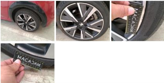
Jante alu AVG bi-ton/polychrome, Griffes(s), Réparer/remplacer (montant forfaitaire)