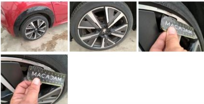
Jante alu ARG bi-ton/polychrome, Griffes(s), Réparer/remplacer (montant forfaitaire)