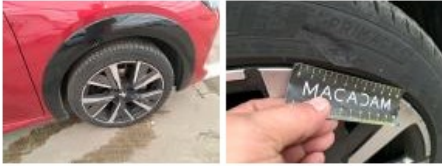
Jante alu ARD bi-ton/polychrome, Déformé / Forcé, E - Remplacer